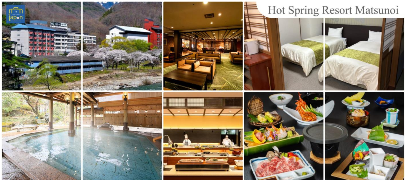
Hot Spring Resort Matsunoi

รับประทานอาหารค่ำ ณ ภัตตาคาร ของโรงแรม (5) --- นูฟเฟ็ดนานาชาติ หลังอาหารให้ท่านได้ผ่อนคลายกับการแช่น้ำแร่ธรรมชาติ เชื่อว่าถ้าได้แช่น้ำแร่แล้ว จะทำให้ ผิวพรรณสวยงามและช่วยให้ระบบหมุนเวียนโลหิตดีขึ้น