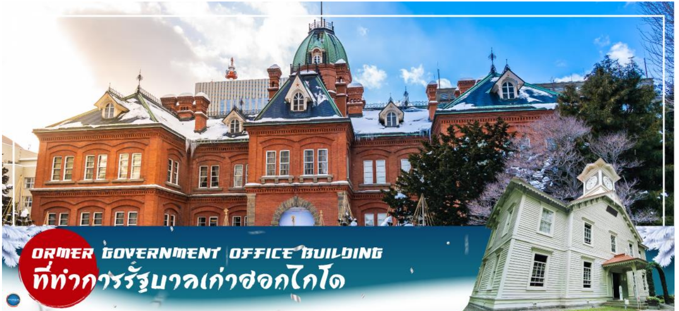
FORMER GOVERNMENT OFFICE BUILDING ที่ทำการรัฐบาลเก่าฮอกไกโด

วันที่สาม เมืองซัปโปโร – ดิวตี้ฟรี – ผ่านชม ศาลาว่าการเมืองฮอกไกโดหลังเก่า – ผ่านชม หอนาฬิกาเมืองซัปโปโร – เมืองอาซาฮิคาว่า – โซออนเคียว – ภูเขาคุโรดากะ (นั่งกระเช้า)** ขึ้นอยู่กับสภาพอากาศ** – ออนเซน