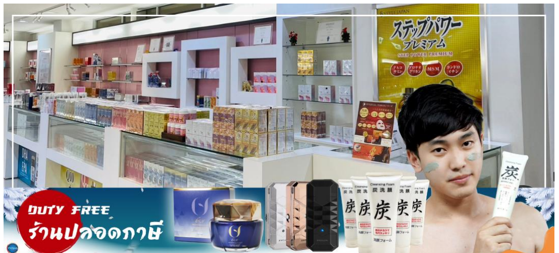
DUTY FREE ร้านปลอดภาษี

จากนั้นเดินทางสู่ เมืองอาซาฮิคาว่า (Asahikawa) (ใช้เวลาเดินทางประมาณ 2.30 ชั่วโมง) เป็นเมืองใหญ่อันดับ 2 ของจังหวัดฮอกไกโด รองจากเมืองซัปโปโร เป็นเมืองศูนย์กลางทางตอนเหนือของเกาะ ล้อมรอบด้วยเทือกเขาไคเซ็ตสึซันและแม่น้ำน้อยใหญ่ มีแหล่งท่องเที่ยวยอดนิยมอยู่หลายแห่ง