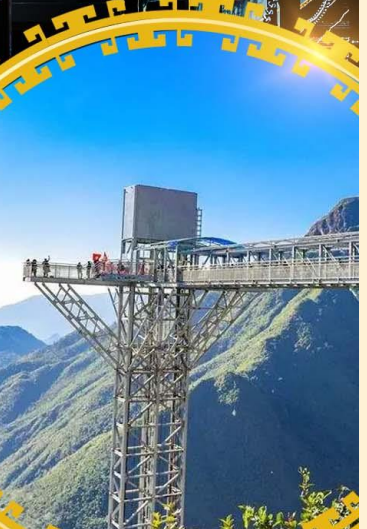
สะพานแกว้มิงกรเมซ