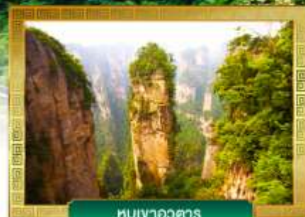
หุบเขาหวงตาร