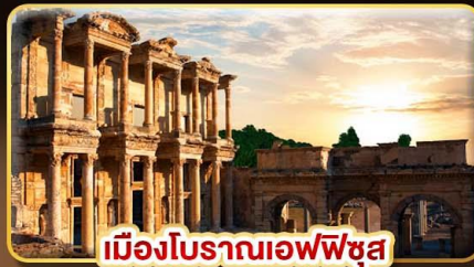
เมืองโบราณเอฟเฟซุส