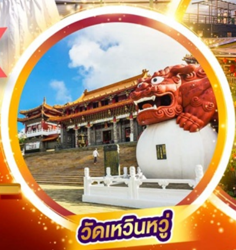
วัดหวินหวู่