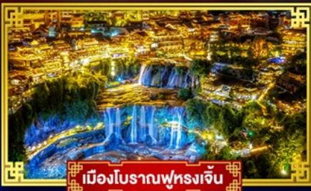
เมืองโบราณฟุทงเจิน

เที่ยว 2 เมืองโบราณ ตะลุยเมืองหิมะ "ICE & SNOW WORLD"