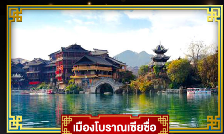
เมืองโบราณเซี่ยซือ