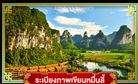
ระเบียงภาพเขียนหมื่นลี้