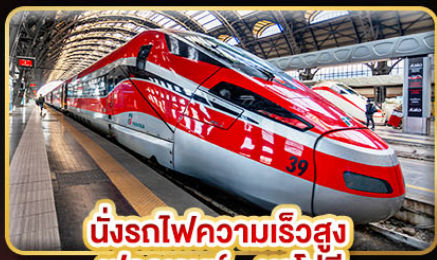
นั่งรถไฟความเร็วสูง ฟลอเรนซ์ - นาโปลี