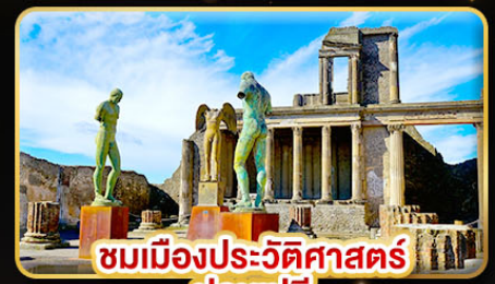
ชมเมืองประวัติศาสตร์ ปอมเปอี