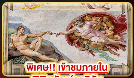
พิเศษ!! เข้าชมภายใน พิพิธภัณฑ์วาติกัน