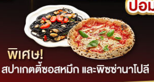
พิเศษ! สปาเกตตี้ซอสหมัก และพิซซ่านาโปลี