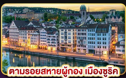
ตามรอยสหายผู้กอง เมืองซูริค