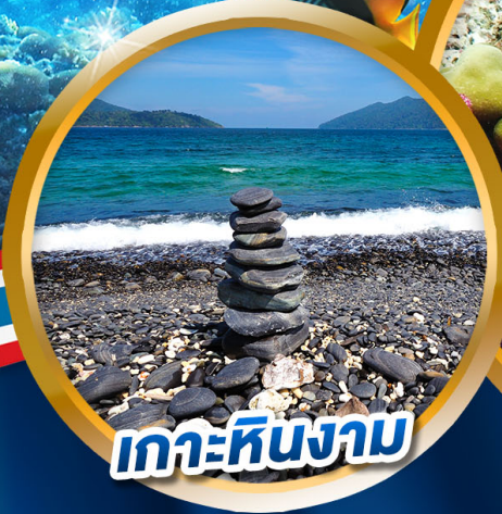
เกาะหินงาม