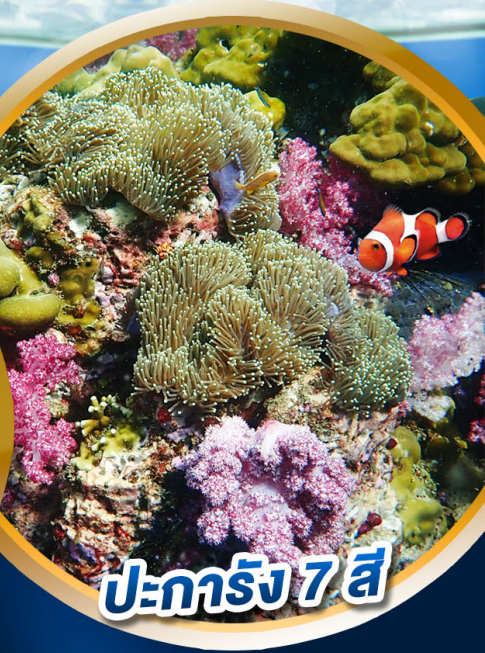
ปะการัง 7 สี