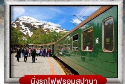
นั่งรถไฟพร้อมสปา

พิเศษ! พักบนเรือสำราญ แบบ Window Room 2 คืน, พักบ้านแซนต้าคลอส