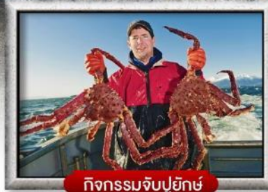
กิจกรรมจับปูยักษ์