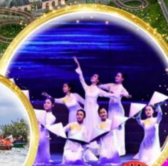
โชว์สุดอลังการ Charming at danang