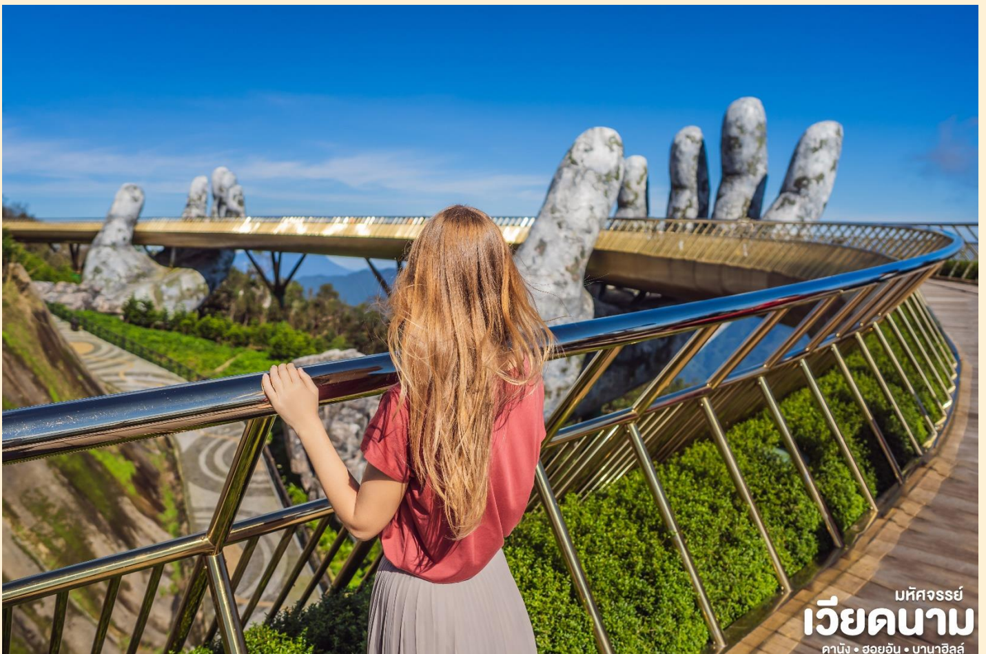
มหัศจรรย์ เวียดนาม ดานัง • ฮอยอัน • บานาฮิลล์

กว่าจะเช้าพร้อมอากาศบริสุทธิ์อันสดชื่นจนทำให้ท่านอาจลืมไปเสียด้วยซ้ำว่าที่นี่ไม่ใช่ยุโรป เพราะอากาศที่หนาวเย็นเฉลี่ยตลอดทั้งปีประมาณ 10 องศาเท่านั้นจุดที่สูงที่สุดของบานาฮิลล์มีความสูง 1,467 เมตรกับสภาพผืนป่าที่อุดมสมบูรณ์ นำท่านชม สะพานสีทอง สถานที่ท่องเที่ยวใหม่ล่าสุดตั้งโดดเด่นเป็นเอกลักษณ์อย่างสวยงาม บนเขาบานาฮิลล์