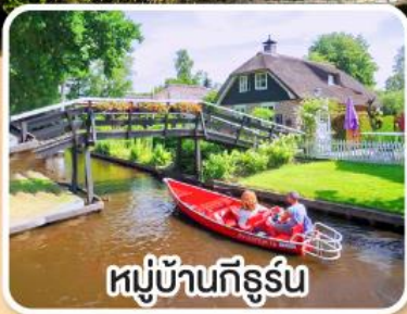
หมู่บ้านกิธูร์น