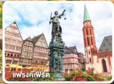
แฟรงค์เฟิร์ต

ฝรั่งเศส เบลเยียม ลักเซมเบิร์ก เยอรมนี เนเธอร์แลนด์ 8วัน 5คืน