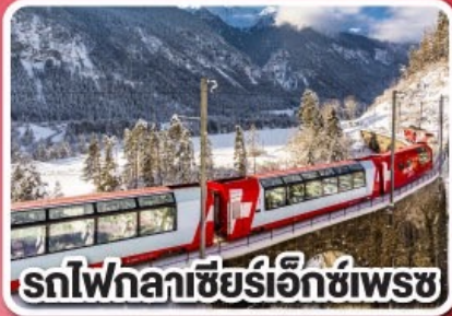
รถไฟกลาซีร์เอ็ทซ์เพรช