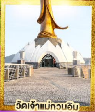
วัดเจ้าแม่กวนอิม