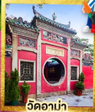
วัดอาบ่า