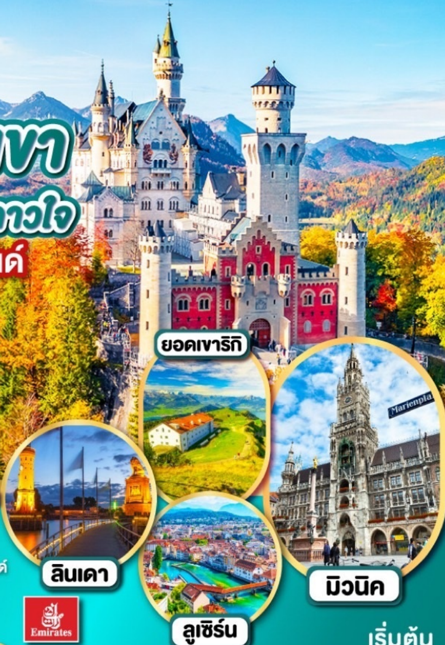
ยอดเขารีกี