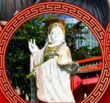
เจ้าแม่กวนอิม รพีลส์เบย์