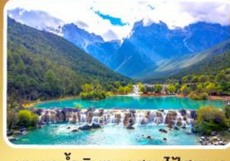
หุบเขาน้ำเงินทะเลสาบโป้สุยเหอ