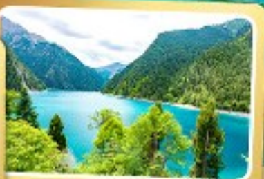
ทะเลสาบยาว