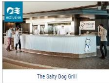
The Salty Dog Grill