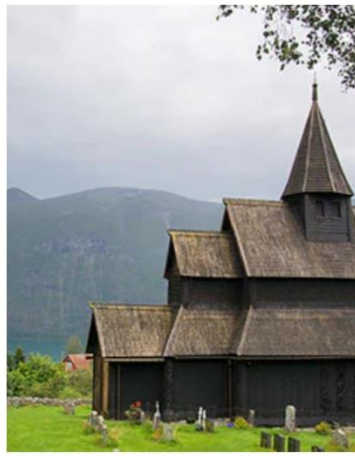
Skjolden / Sognefjordsd, Norway