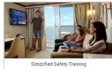
Simplified Safety Training