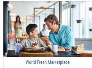
World Fresh Marketplace