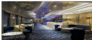
Princess Live! Café