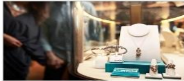
The Shops of Princess