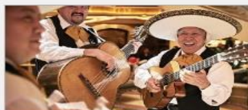
Music & Dancing