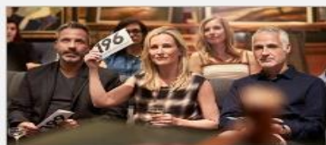
Art Gallery & Auctions