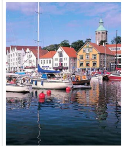
Stavanger , Norway