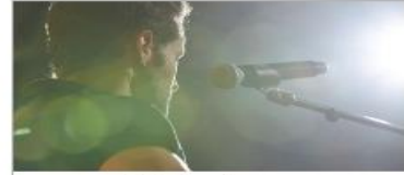
Vista Show Lounge