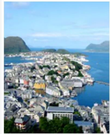
Alesund , Norway