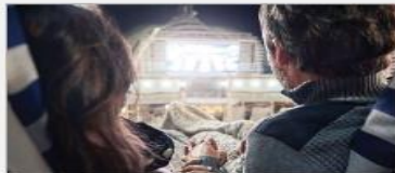
Movies Under the Stars®

On every Princess ship, you'll find so many ways to play, day or night. Explore The Shops of Princess, celebrate cultures at our Festivals of the World or learn a new talent – our onboard activities will keep you engaged every moment of your cruise vacation. 1