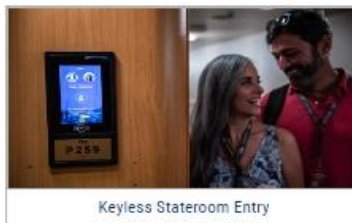
Keyless Stateroom Entry