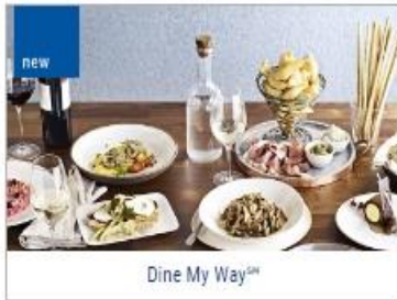
Dine My Way™

Indulge your appetite whenever you wish on board Princess®. Every hour, our chefs are busy baking, grilling and sautéing great-tasting fare from scratch. Princess offers unparalleled inclusive dining options throughout the ship with a wide range of culinary delights to suit any palate, from endless buffet choice to gourmet pizza, frosty treats, decadent desserts and much more.¹