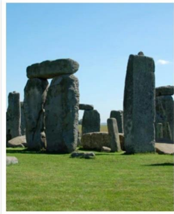
Southampton (London), England