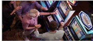
Vegas Style Casino