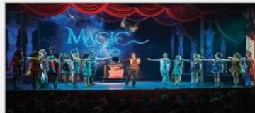
Original Musical Productions