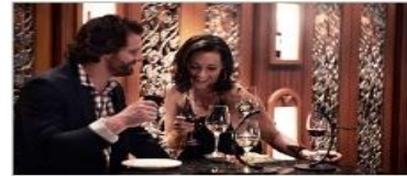
Vines Wine Bar