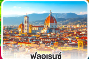
ฟลอเรนซ์