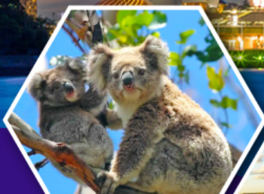
ชมหมีโควาล่า ณ สวนสัตว์ซิดนีย์