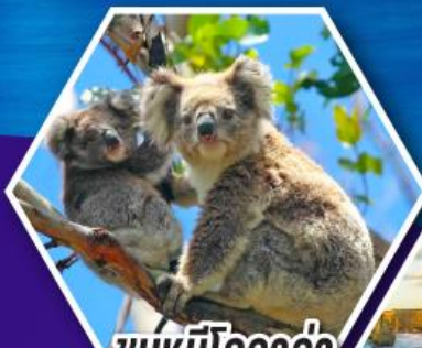
ชมหมีโคอาล่า ณ สวนสัตว์ซิดนีย์