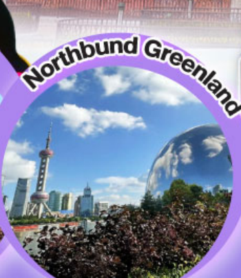
the roof shanghai