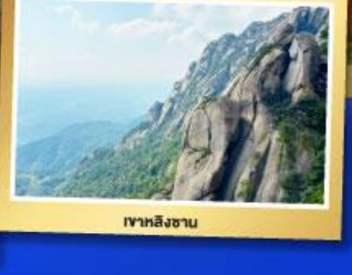
เขาหลงซาน