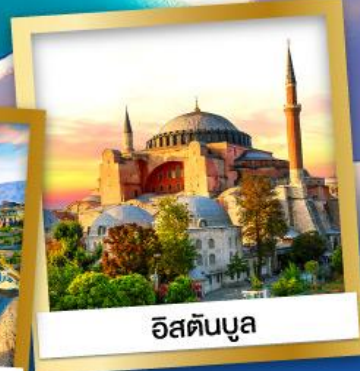
อิสตันบูล