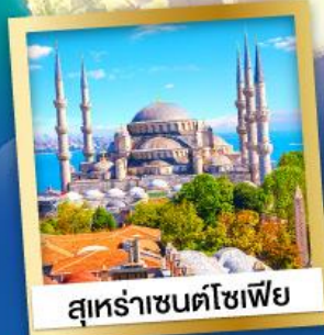
สุเหร่าซนต์โซเฟีย