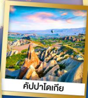
คัมปาโดเกีย