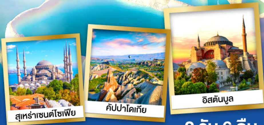
สุหระาเซนตโซเฟีย