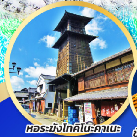
หอรบั้งโทคิโนะคาเนะ