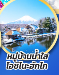
หมู่บ้านน้ำใส ไอชิโนะอัทสึ