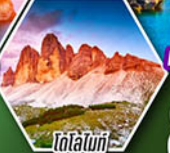
โดโลไมท์

โปรแกรมเดียว เก็บครบจบ อิตาลี ตั้งแต่เหนือถึงใต้