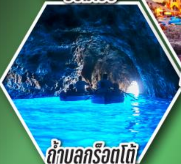
ถ้ำบลูกร็อตโต้