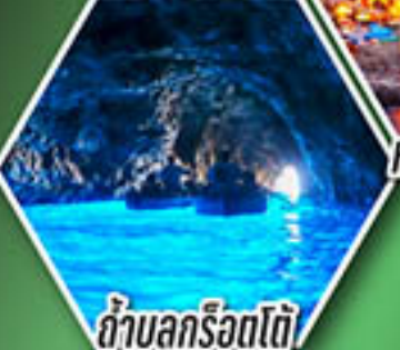
ถ้ำลูกรोटโต้