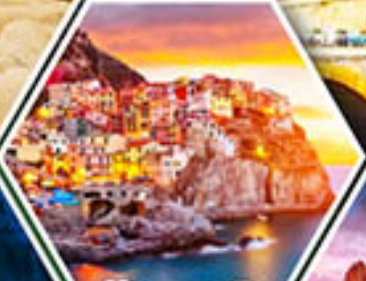
หมู่บ้านมาราโรลา