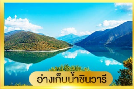
อ่างเก็บน้ำชินวารี