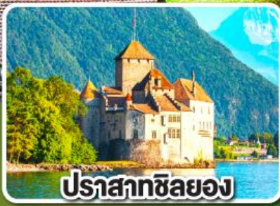
ปราสาทซิลยง