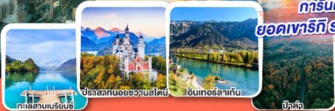
ทะเลสาบเบเรียนซ์

การันตีได้ค้ำคินบน ยอดเขาริ ราชนิแห่งขุนเขาสวิส.