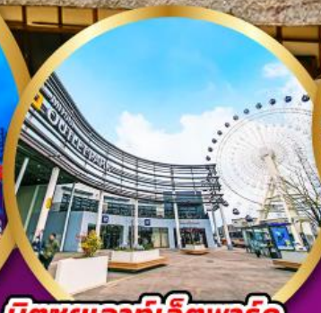
มิตซูเอากะไลท์พาร์ค เซนได