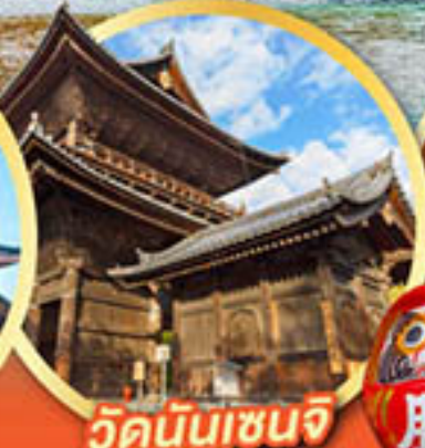
วัดนินเซินจิ