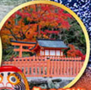
วัดคารุมะ