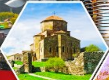
วิหารจวารี