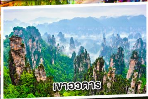
เขาอวดตาร