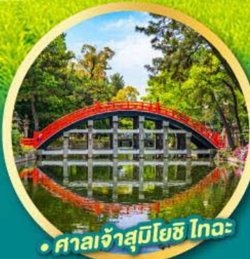
• ศาลเจ้าสุมิโยชิ ไทวะ