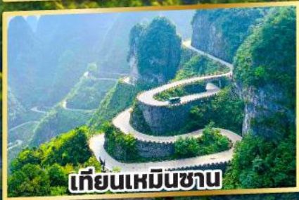
เทียนเหมินซาน