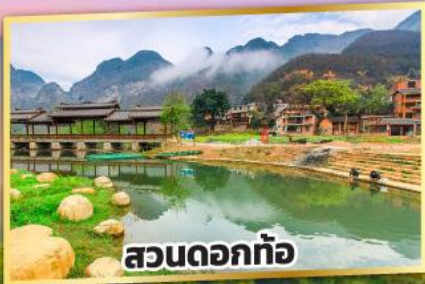
สวนดอกท้อ