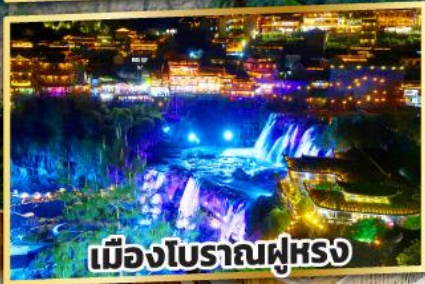
เมืองโบราณฝูหรง