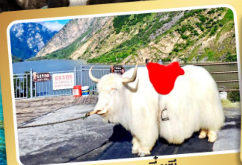
ทะเลสาบเตี้ยซี