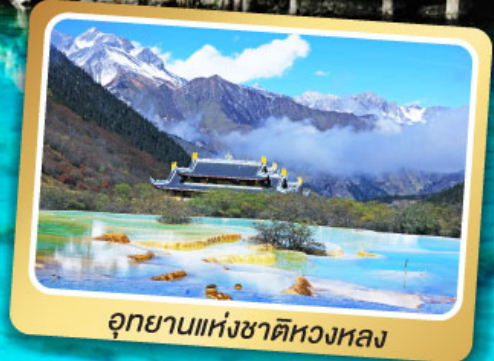
อุทยานแห่งชาติหลวงหลอง