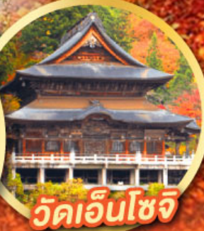
วัดเอ็นโซจิ

กิจกรรมเก็บผลไม้ พักออนเซ็น 2 คืน พักโรงแรมในโตเกียว 2 คืน