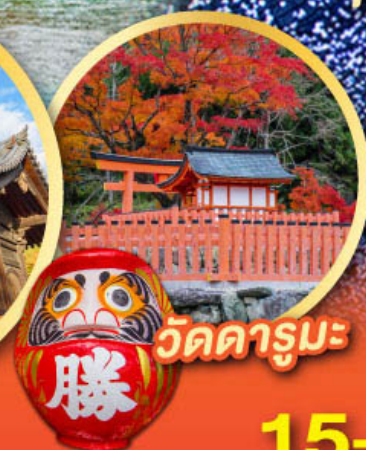
วัดดารุมะ