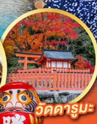
วัดคารุมะ