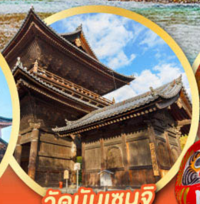
วัดนินเซนจิ