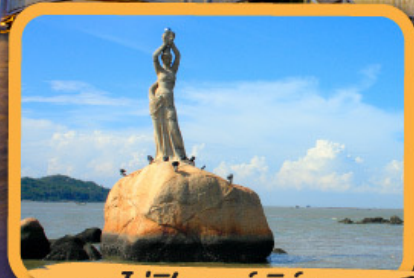
• จุฬารัตนเซนต์จอร์จ