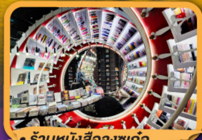
• ร้านหนังสือจตุจักร