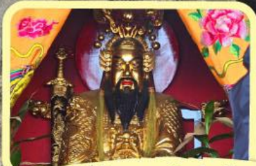
• เอียงบู๊ซิว (ศาลเจ้าพ่อเสือ)