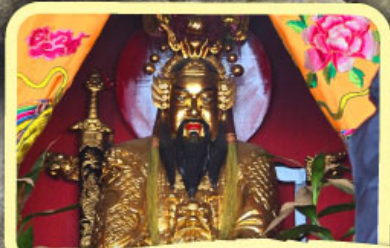
• เอียงบู๊ซิว (ศาลเจ้าพ่อเสือ)