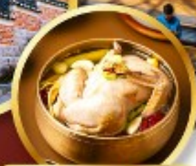
ไก่ตุ๋นโสม ระดับมิชลิน

พิเศษ เมนูไก่ตุ๋นโสม ภัตตาคารระดับมิชลิน