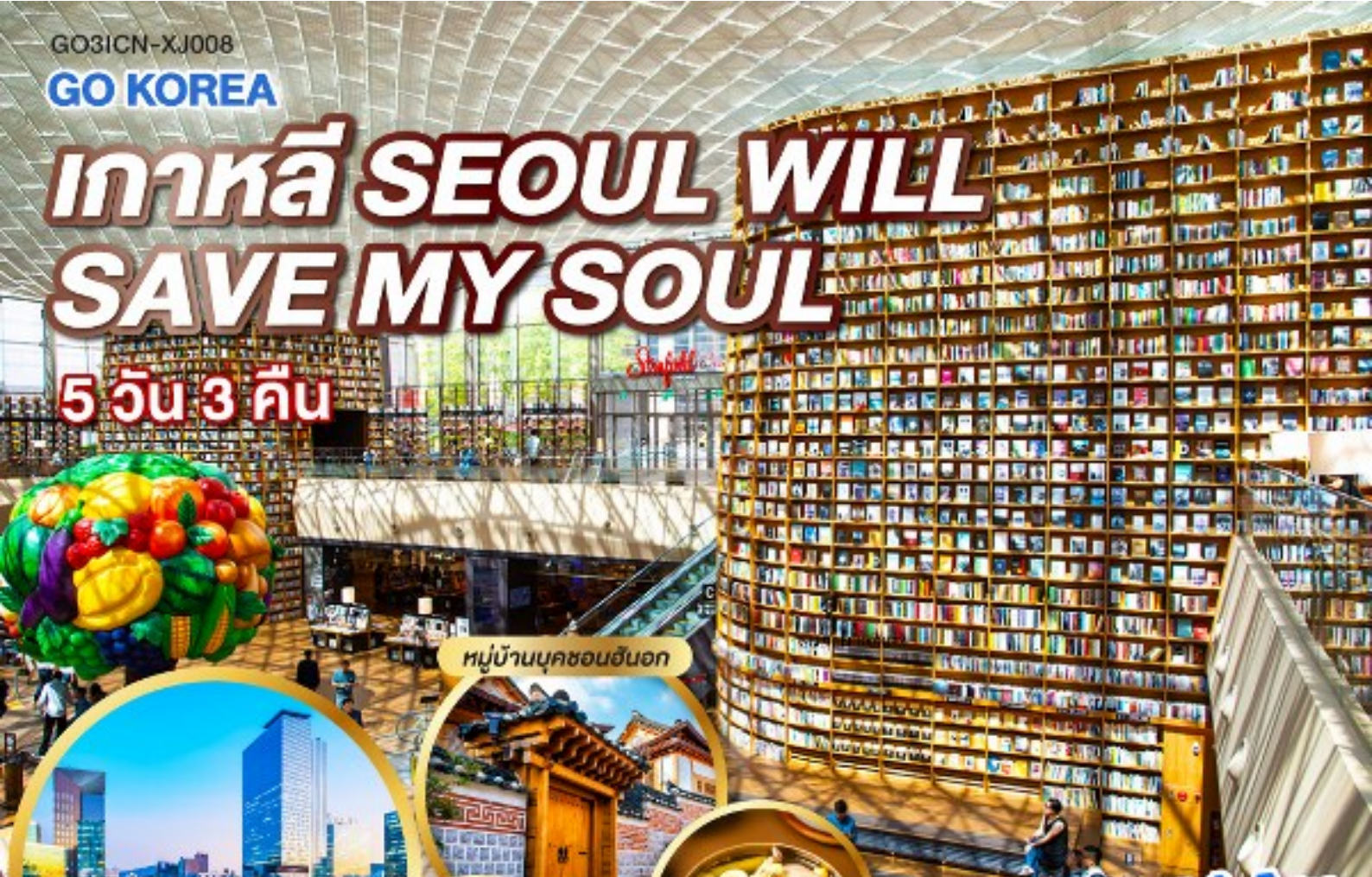
หมู่บ้านบุคchonอินอก