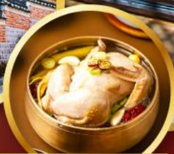
ไก่ตุ๋นโสม ระดับมิชลิน