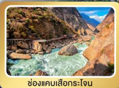
ช่องแคบเสือกกระโจน