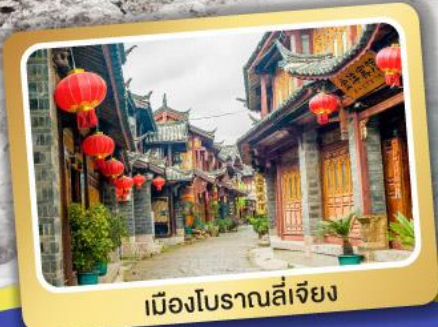
เมืองโบราณลี่เจียง