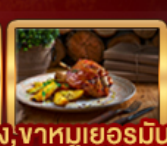
Ribs of Vienna, ปลาเทราสียง, จาหมูเยอรมัน