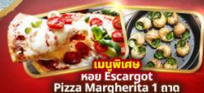
เมนูพิเศษ หอย Escargot Pizza Margherita 1 ถาด

อิตาลี มหาวินาศดูโอโม ชมสิ่งมหัศจรรย์ของโลก โคโลสเซียม หอเอนปิซ่า สวิส พิชิตยอดเขาจุงเฟรา "TOP OF EUROPE" สะพานไม้ชาเปล รูปปั้นสิงโต ฝรั่งเศส เข็ควอนปารีส หอไอเฟล ประตูชัย ฝรั่งเศส นั่งรถกระเช้าไฟฟ้ามงต์มาตร์ ล่องเรือแม่น้ำแซนชมเมือง ซ็อบบิงแบรนต์เนมห้างปลอดภาษี เอาท์เล็ต