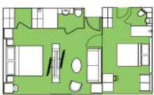
Brynhilde Suite BS Two Bedroom Suite (1) 52 sqm, French Balcony