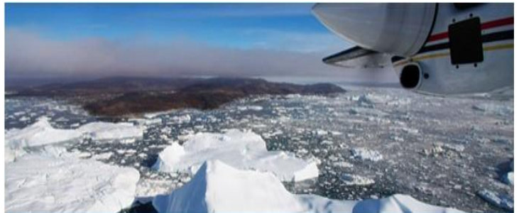
ICE-FJORD FLIGHT SIGHTSEEING, ILULISSAT, GREENLAND

* หมายเหตุ : ทั่วๆไปโดยเครื่องบินเล็กนี้จะขายหมดอย่างรวดเร็ว ดังนั้นจำเป็นต้องจองล่วงหน้า