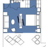
CATEGORY A Junior Suite (4) 40 sqm, incl. Balcony