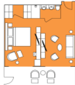
Freydis Suite FS Premium Suite (1) 43 sqm, incl. Balcony