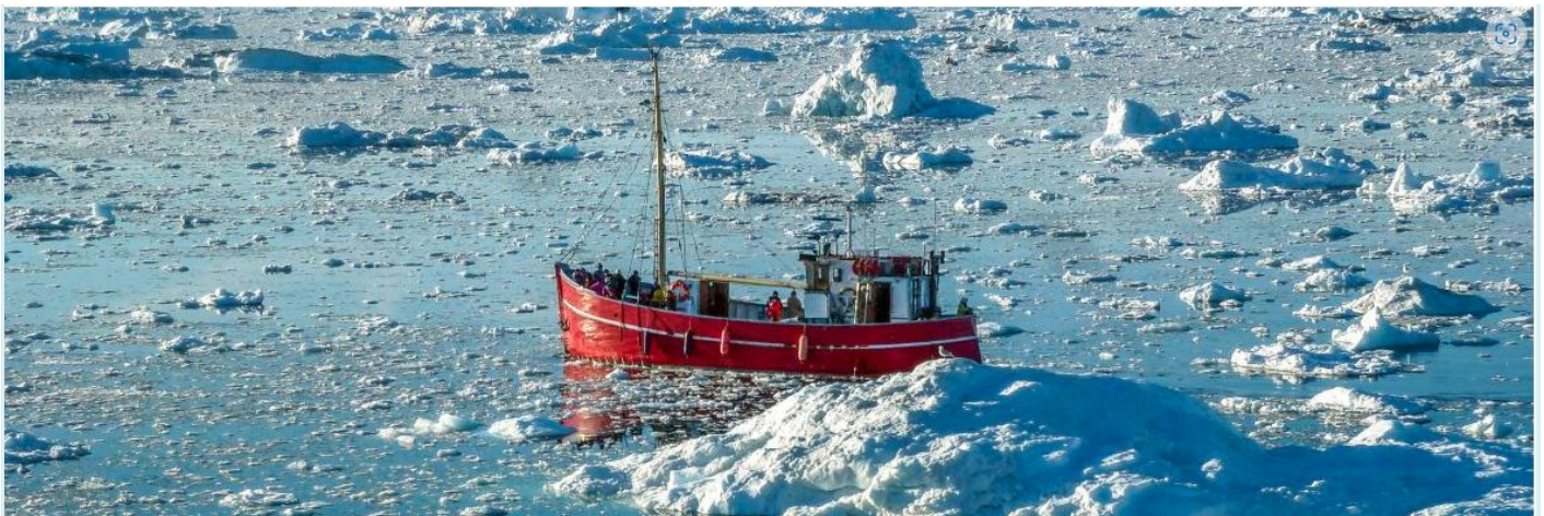
BOAT TRIP TO THE ICE-FJORD, ILULISSAT, GREENLAND

บ่าย นำท่าน ล่องเรือเล็กไปยังฟยอร์ดน้ำแข็ง การเดินทางใช้เวลาประมาณ 2 ชั่วโมงและเป็นโอกาสในการชมทิวทัศน์ที่แกะสลักน้ำแข็งอันน่าทึ่งอย่างใกล้ชิด การล่องเรือครั้งนี้เป็นอะไรที่ไม่ธรรมดาและเป็นประสบการณ์ทางธรรมชาติที่ขอดีเยี่ยมที่ท่านจะจดจำไปอีกนานเท่านาน