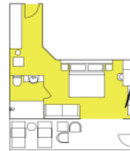
CATEGORY B Balcony Suite (6) app. 32 sqm, incl. Balcony