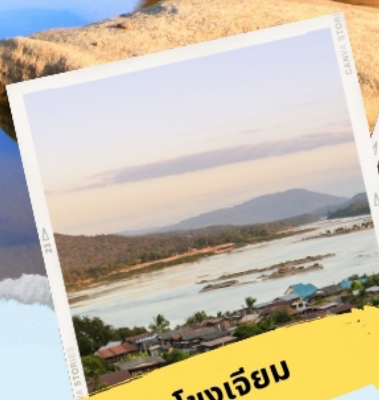
โขงเจียม

ชุมชนบ้านปะอ่าว ,วัดหนองบัว ,วัดสระประสานสุข ชมพระอุโบสถที่เป็นรูปเรือสุพรรณหงส์ ล่องเรือชมแม่น้ำสองสี ,สามพันโบก ,วัดสิรินธรวรารามภูพร้าว วัดเรืองแสง ,อุทยานแห่งชาติผาแต้ม ชม ภาพเขียนสีก่อนประวัติศาสตร์ มีอายุประมาณ 3,000 - 4,000 ,แก่งตะนะ